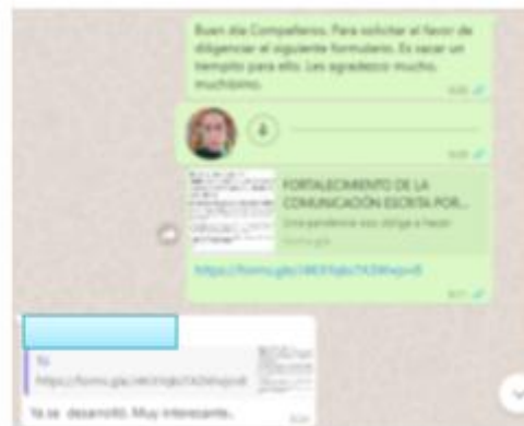
Figura 2. Solicitud a docentes y enlace del formulario por WhatsApp