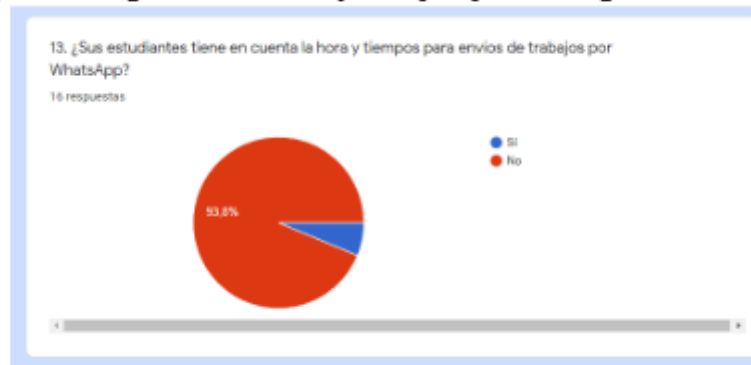
Figura 5. Pregunta 13, Horas y tiempos para entrega de actividades