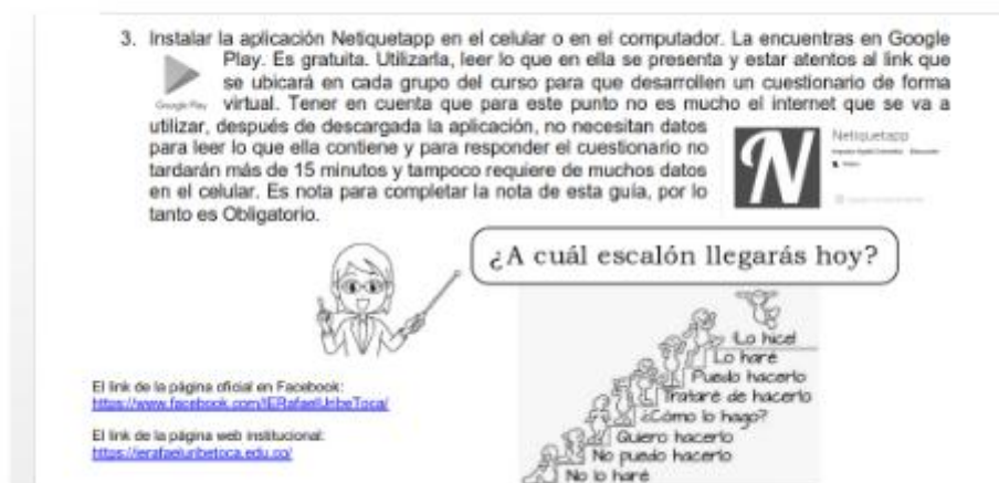
Figura 1. Guía enviada a estudiantes en el segundo periodo académico

con el buen uso de WhatsApp para el proceso de comunicación escrita en el momento de recibir actividades desarrolladas de acuerdo a las guías enviadas. Las preguntas se enfocaban a aquellas actitudes que pueden tener los estudiantes en el momento de enviar evidencias, entre ellas: un saludo, redacción y ortografía en el mensaje que ellos querían expresar, respeto por los horarios establecidos para dicha entrega, una despedida respetuosa, algún tipo de plagio que se haya identificado, entre otras que hacen parte de lo que la aplicación quiere enseñar a los estudiantes. Las indicaciones, se presentaron a los estudiantes por medio de un punto de las guías que se solicitaban desarrollar, a los docentes por medio de un grupo en WhatsApp. Figuras 1 y 2.