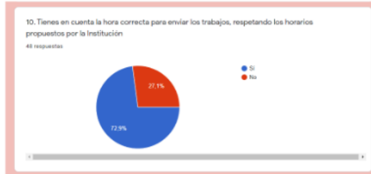
Figura 7. Respetar horarios propuestos por la Institución

tuvieran que seleccionar una respuesta. Y en algunos casos se les pedía escribir una frase corta en la que justificaban sus respuestas.