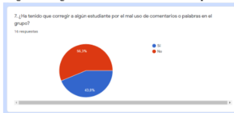
Figura 3. Pregunta 7. Mal uso de comentarios o palabras

A continuación se presentan algunas preguntas relevantes, mediante figuras en las que se demuestran los datos, directamente con resultados generados por el mismo aplicativo de Formularios de Gmail: