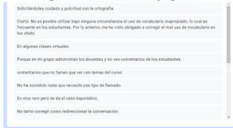
Figura 4. Justificaciones a la pregunta 7